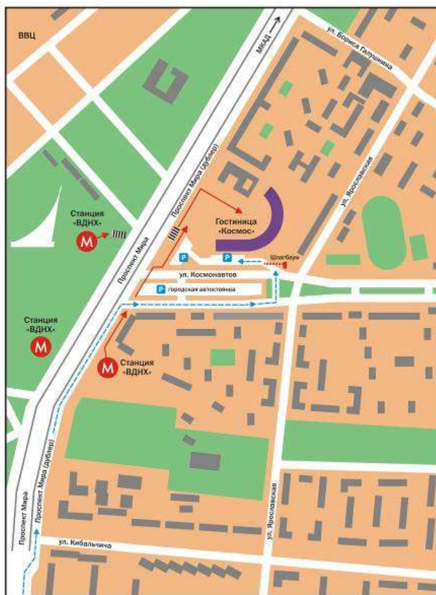
Схема проезда к гостинице "Космос"